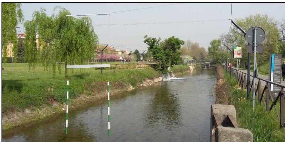
- impianto slalom percorso canoe -