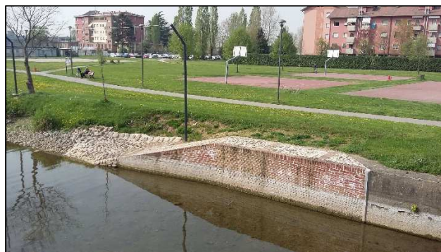
- approdi monte e valle -